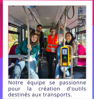
Notre équipe se passionne pour la création d'outils destinés aux transports.

Ces audioguides sont immersifs: les passagers prêtent une attention particulière aux informations partagées et vos publicités seront remarquées.